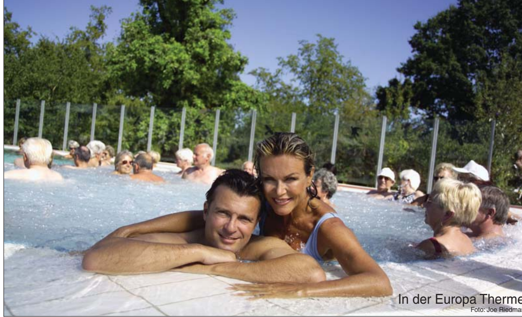
In der Europa Therme