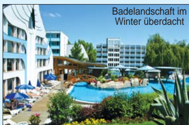
Badelandschaft im Winter überdacht